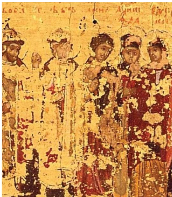
Илл. 2. Святые Анна, Олимпиада, Евпраксия. Фрагмент минейной иконы на июль, Россия. Первая четверть XVII в. Монастырь Св. Павла на Афоне