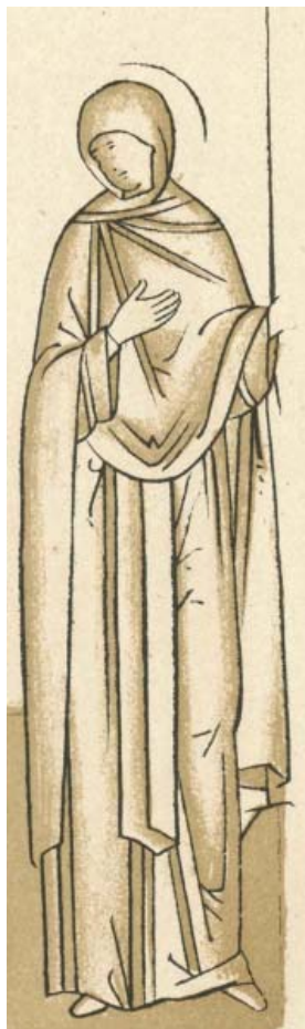
Илл. 1. Святая Олимпиада. Прорись под 25 июля. Строгановский лицевой подлинник. Рубеж XVI – XVII вв.