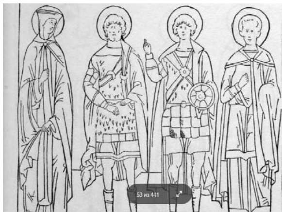
Илл. 3. Святая Параскева Епиватская, мученики Миланские Назарий, Гервасий, Кельсий. Прорись под 14 октября. Строгановский лицевой подлинник. Рубеж XVI-XVII вв.