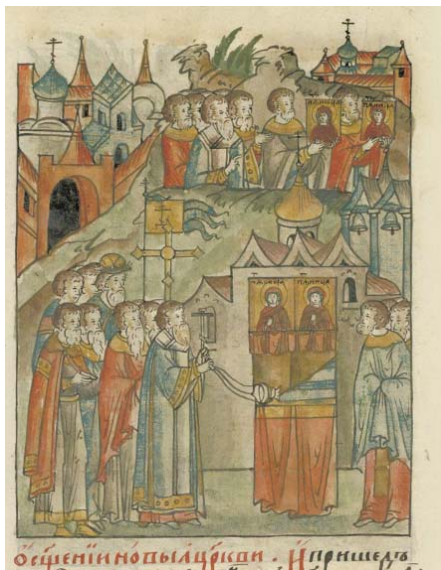
Илл. 4. Освящение новой церкви в честь икон святых Параскев из Ржева в Москве 11 ноября 1531 г. Миниатюра. 1570-е гг. Лицевой летописный свод, Шумиловский том РНБ. FIV. 232. Л. 914об.