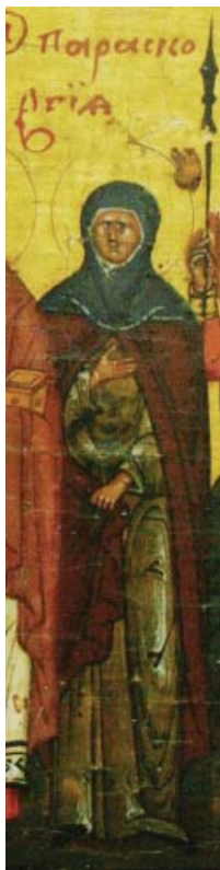
Илл. 5. Прп. Параскева Епиватская. Фрагмент минейной иконы на октябрь. Начало XVII в. ЦАК МДА.