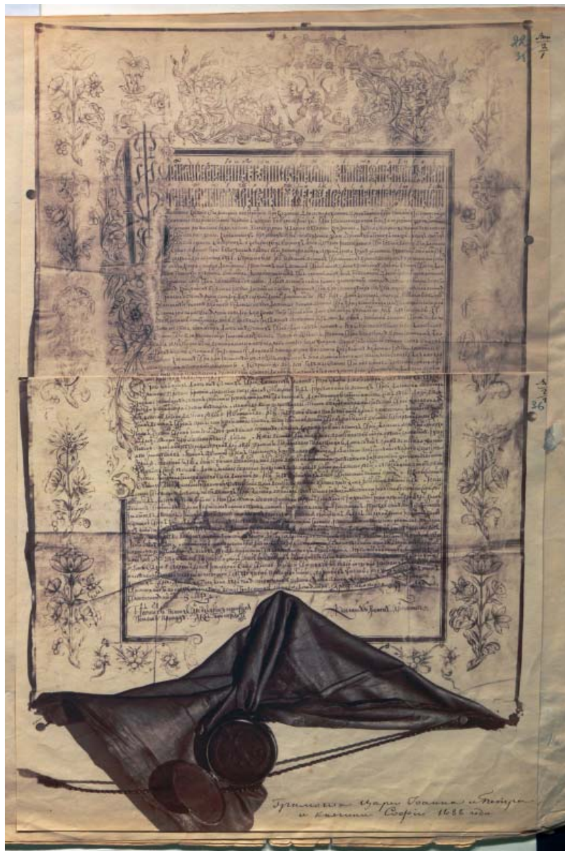
Илл. 1. Жалованная грамота царей Ивана Алексеевича, Петра Алексеевича и царевны Софьи Алексеевны афонскому Благовещения Богородицы Ватопедскому монастырю 1688 г.