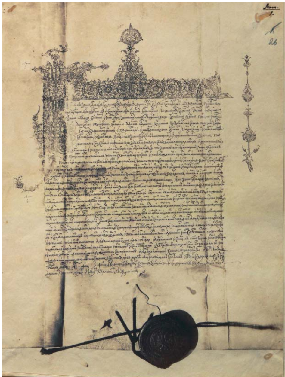
Илл. 2. Жалованная грамота царя Михаила Федоровича и Московского патриарха Филарета афонскому Благовещения Богородицы Ватопедскому монастырю 1626 г.